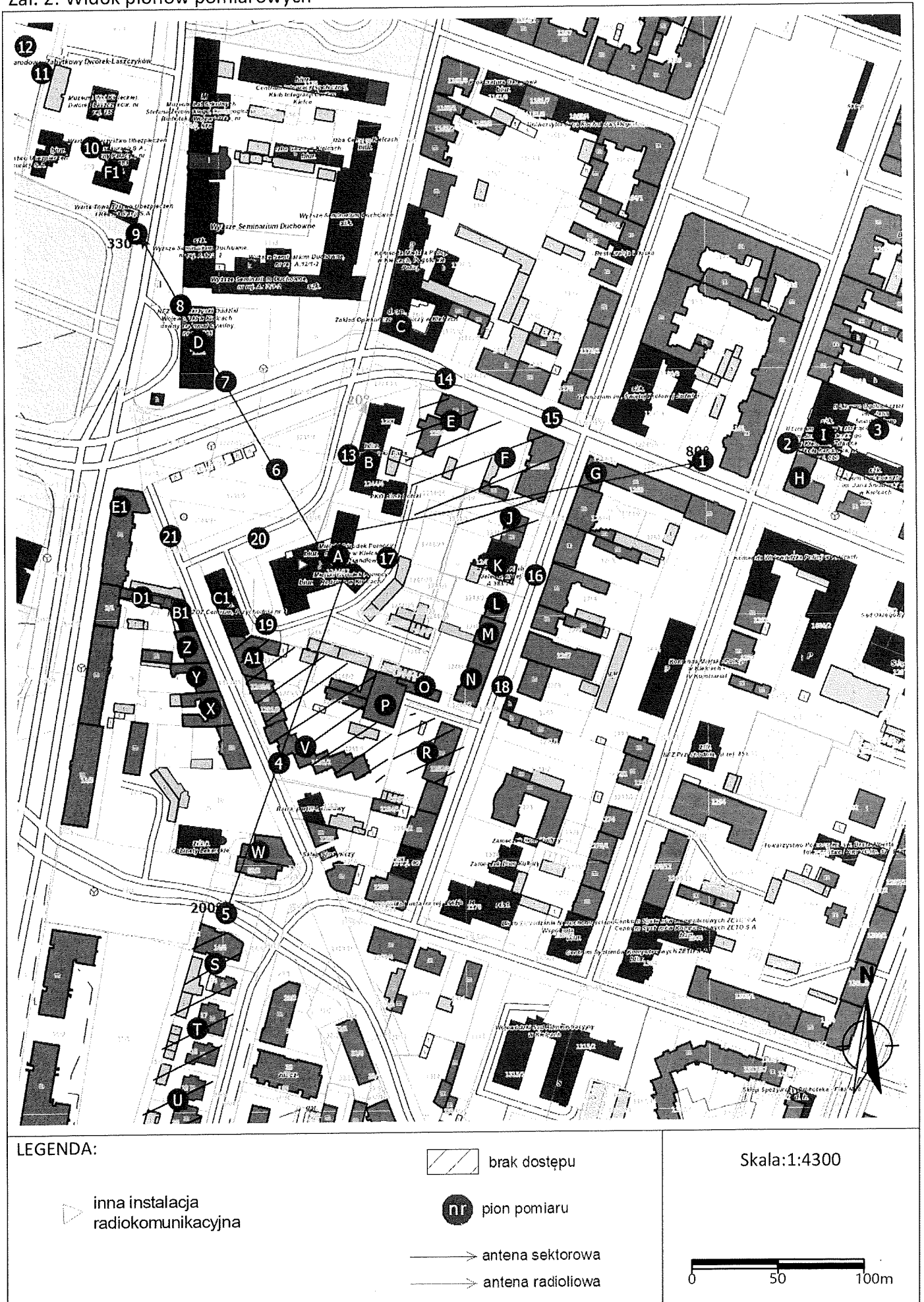
Zał. 2. Widok pionów pomiarowych