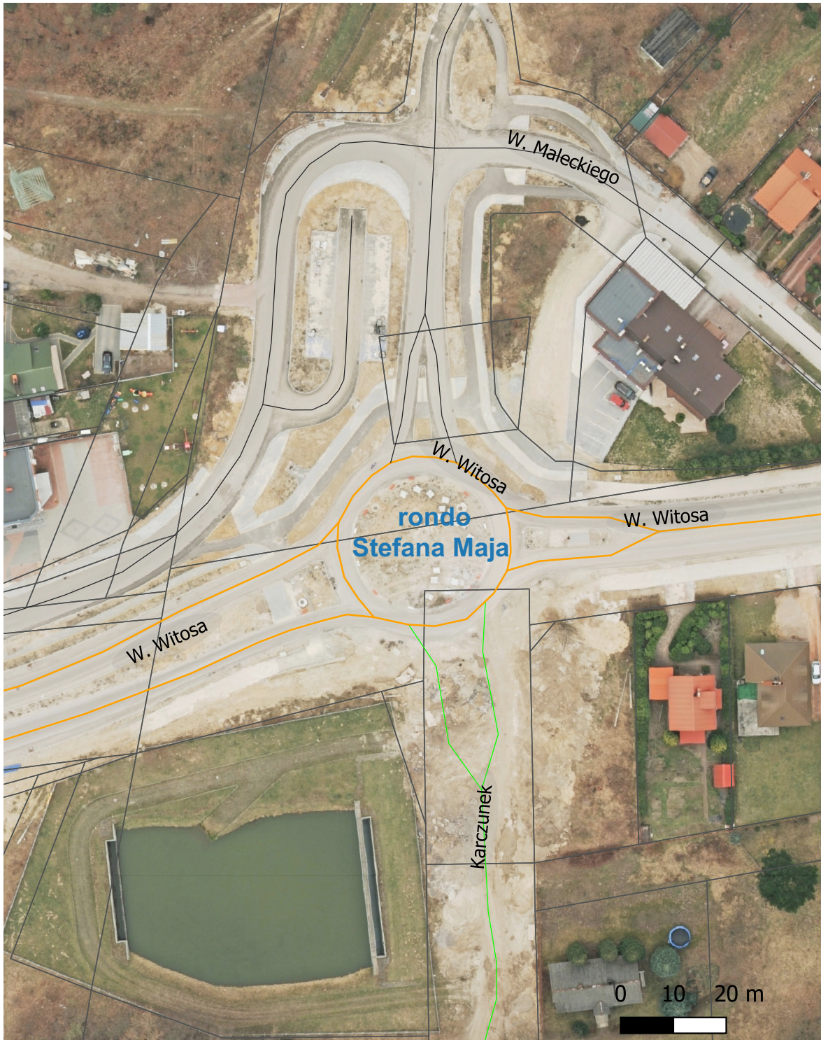
mapa, stan na 28.09.2022 r.