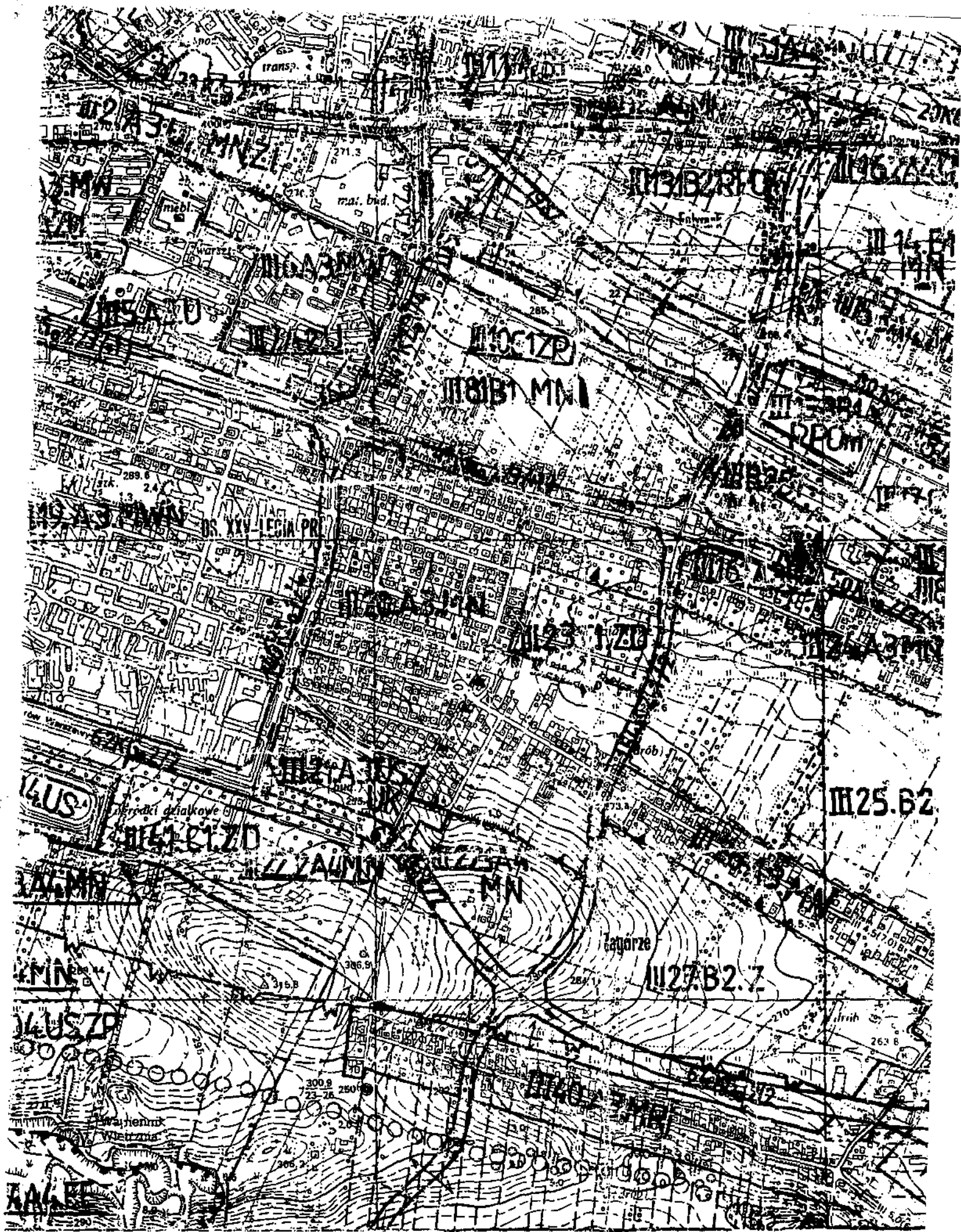
FRAGMENT MIEJSC. PLANU OGÓLNEGO ZAGOSPOD. PRZESTRZ. m. Kielce