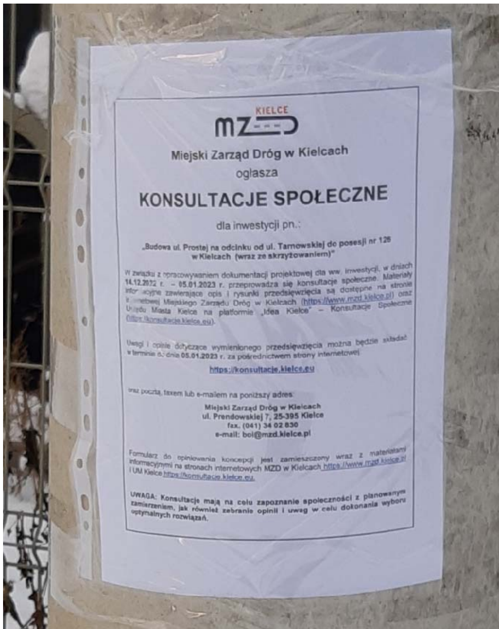
Fot. nr 2 . Kopia ogłoszenia zamieszczana na tablicach ogłoszeń.