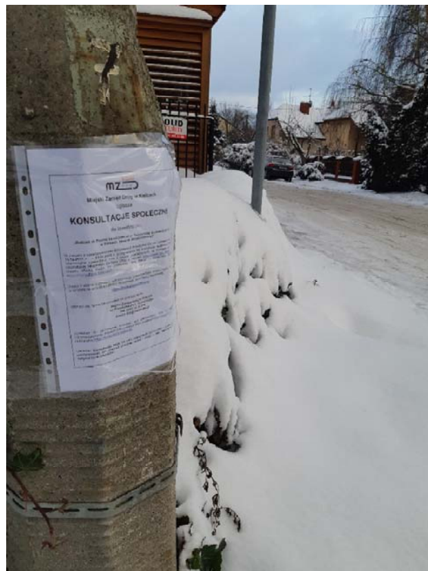
Fot. nr 3-12 . Ogłoszenia rozmieszczone na obszarze zadania