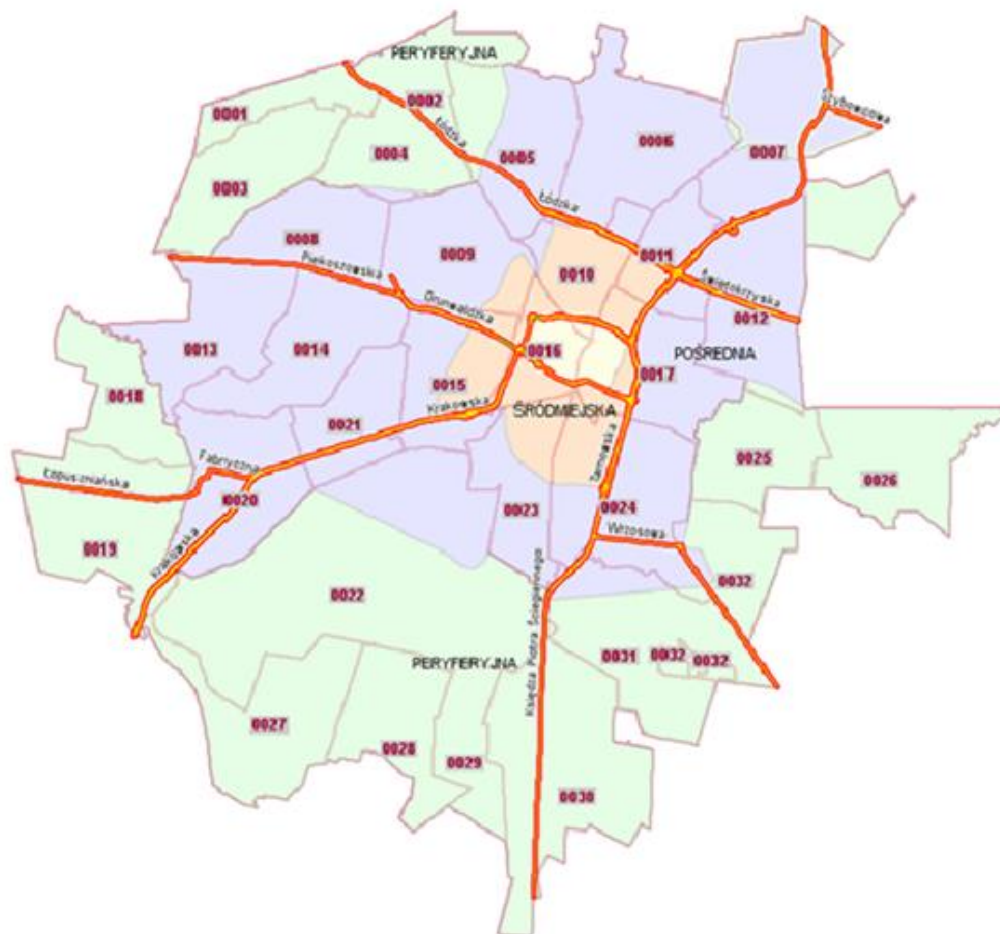
PODZIAŁ NA STREFY LOKALIZACJI SEZONOWYCH OGRÓDKÓW GASTRONOMICZNYCH NA TERENIE MIASTA KIELCE