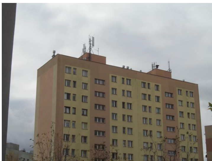
Zał. nr 1: Widok ogólny instalacji radiokomunikacyjnej.

Koniec sprawozdania. Sprawozdanie zawiera dodatkowo załączniki nr 1 i 2.