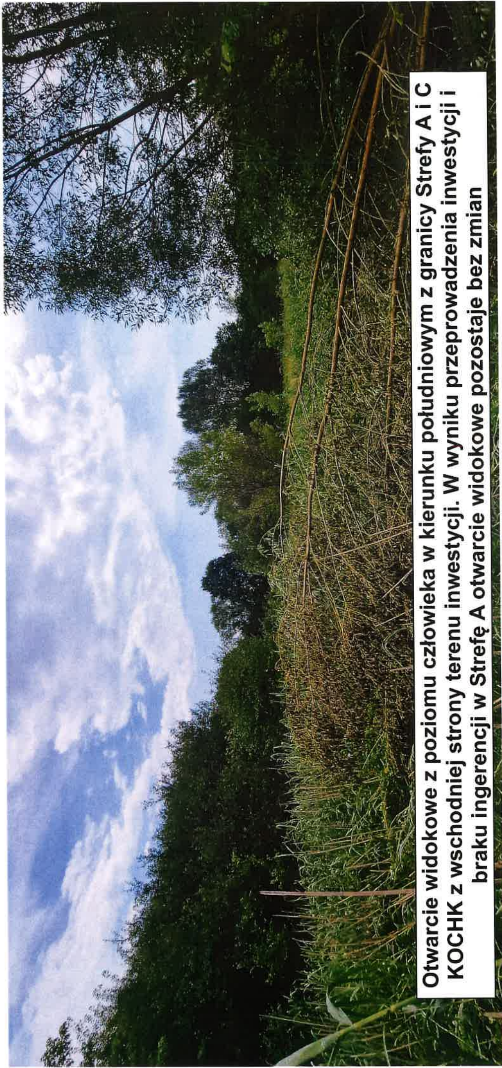
Otwarcie widokowe z poziomu człowieka w kierunku południowym z granicy Strefy A i C KOCHK z wschodniej strony terenu inwestycji. W wyniku przeprowadzenia inwestycji i braku ingerencji w Strefę A otwarcie widokowe pozostaje bez zmian