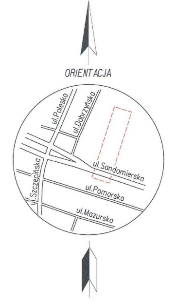
MAPA DO CELÓW PROJEKTOWYCH skala 1:500