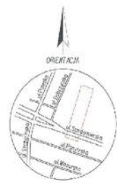
MAPA DO CEŁÓW PROJEKTYWYCH skala 1:500

Kartograficzny zespół projektowy: 160-16044-01512/0 Jednostka wykonawcza: 24/02_1, Kielce, Kielce Opis: ewidencja 602, Mapa Kijów Data: ewidencja 57025, 4304, 654/1 Masa: 1/100000000 - ewidencja 1/100000000 - system: 1/100000000 Sfery: 1/100000000 - ewidencja 1/100000000 1/100000000 - ewidencja 1/100000000